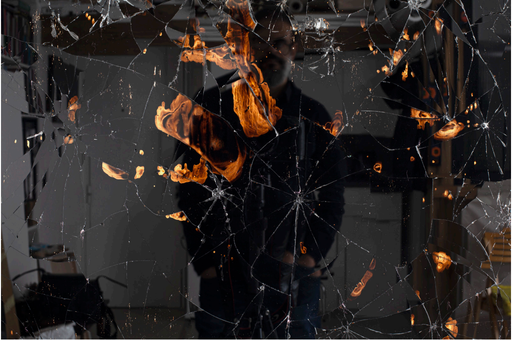
زُعرَب، تفصيل من زمن الزيت/ زفت تايم رقم 4 (بيروت)، 2021

قطران وزجاج ووسائط متعددة على خشب، 222x65 سم