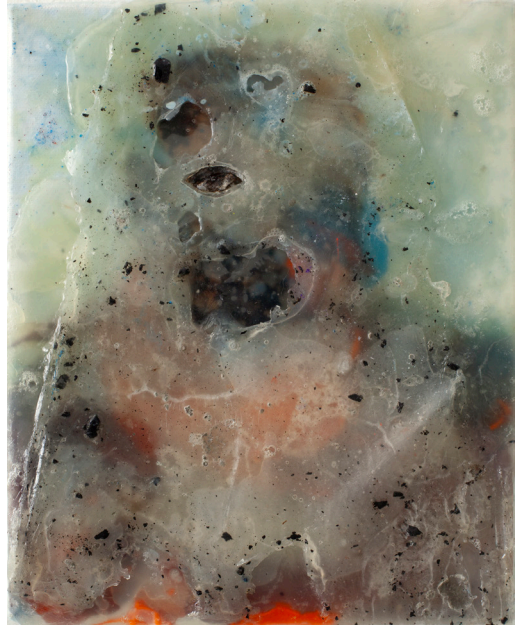
هاني زُعرَب، الفلسطيني رقم 14، 2025 قطران ووسائط ومواد متعددة على قماش، 27x22 سم