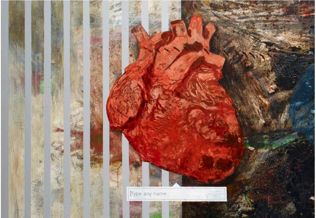
هاني زعرب، تفصيل من اطبع أي اسم...، 2015 قطران ومواد مختلفة على قماش، 429x192 سم