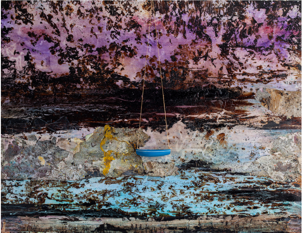
هاني زُعرَب، المعذرة سيد كيفير، هذا هو جرحنا، 2021 قطران ووسائط ومواد متعددة على قماش، 10x160x210 سم