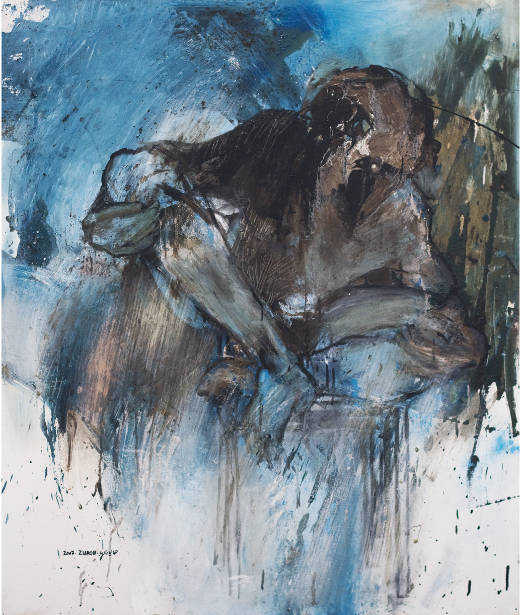
هاني زُعب، تأهَّب رقم 3، 2007