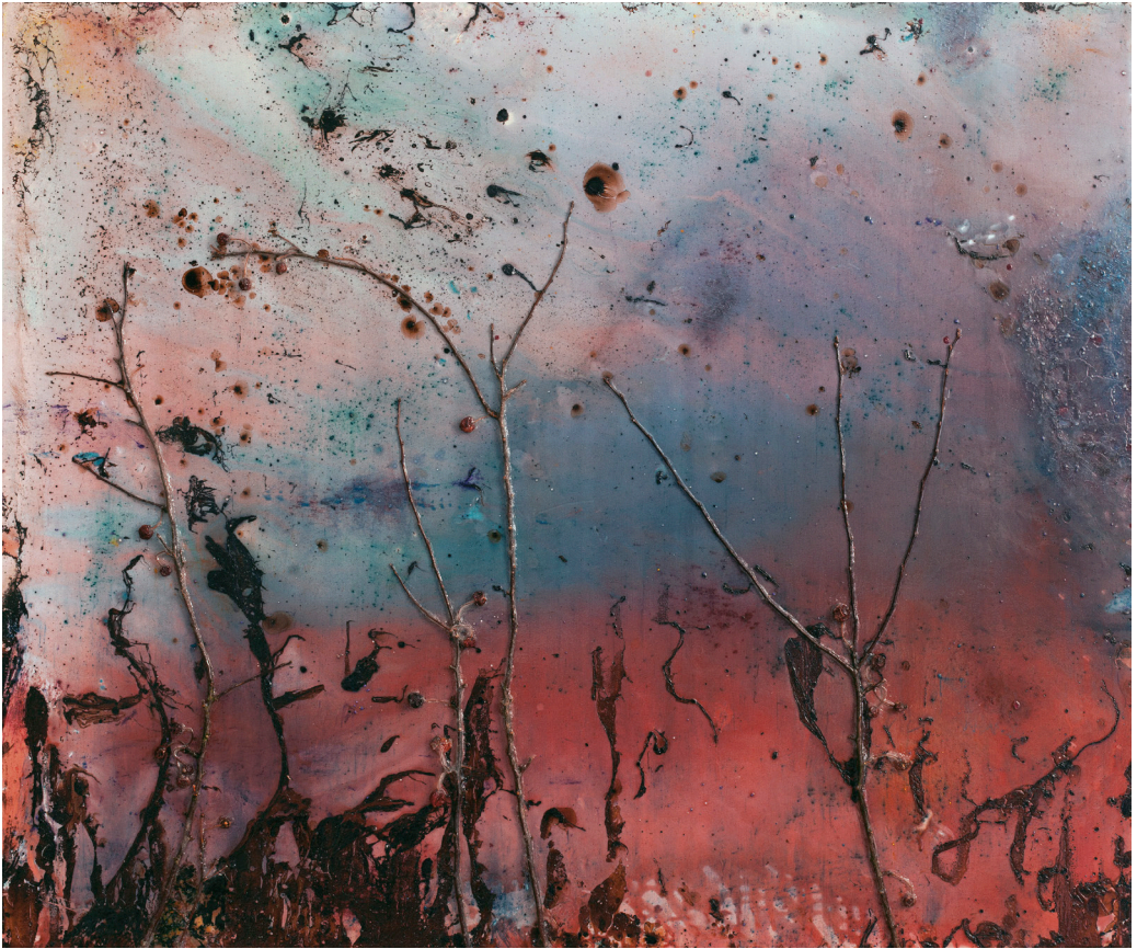
هاني زُعب، أرض الريف/ زفت لاند رقم 8، 2019 قطران ووسائط متعددة على قماش، 100x120 سم