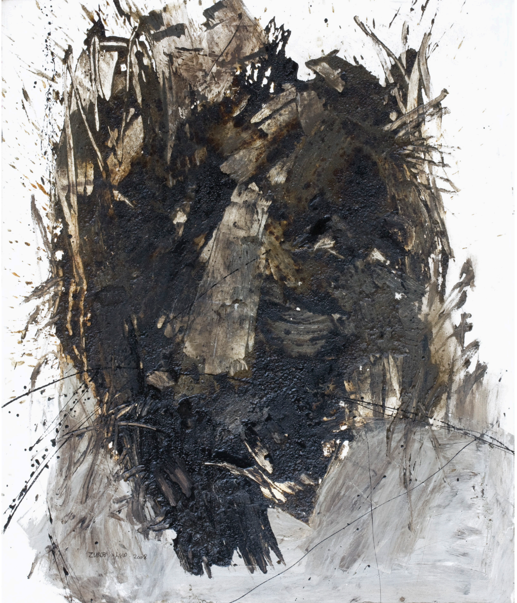
هاني زُعرَب، تَاهِبُ رِقْم 10، 2008