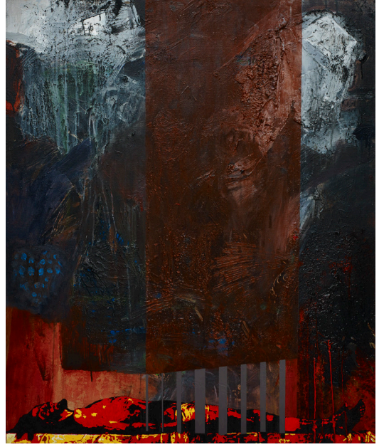
هاني زُعرَب، يسوع، ارقد بسلام مجدداً...، 2015 قطران ومواد مختلفة على قماش، 100x120 سم