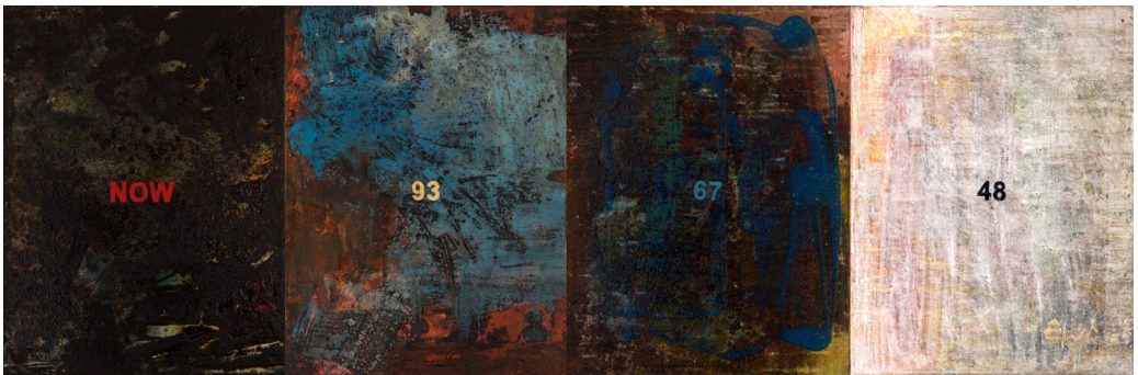
هاني زُعب، 48-67-93 الآن، 2016