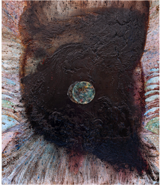
هاني زُعب، الذاكرة قبالة التذكّر (ثنائية)، 2023 قطران ووسائط ومواد متعددة على قماش، 240x140 سم