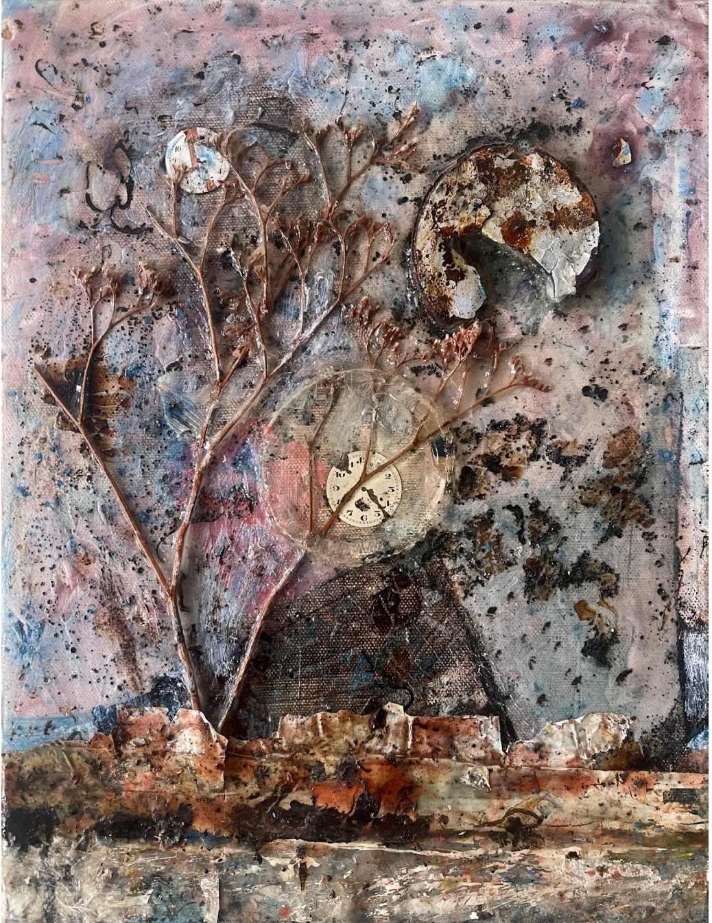
هاني زُعرَب، زمن عالق، 2016

قطران ووسائط ومواد متعددة على قماش، 35x27 سم