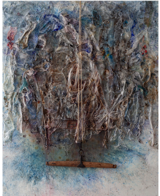
هاني زُعرَب، لماذا تركت الخيمة وحيدة؟ 2024 قطران ووسائط ومواد متعددة على قماش، 200x160x12 سم