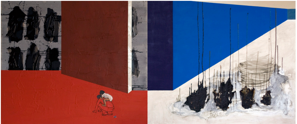
هاني زُعرَب، درس في الطيران رقم 1 (ثنائية)، 2009