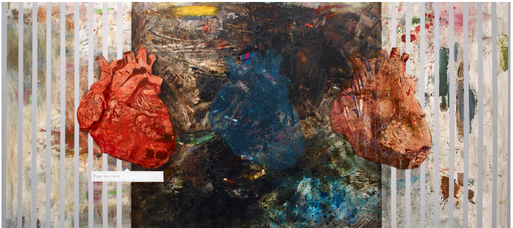
هاني زعرّب، اطبع أيّ اسم...، 2015