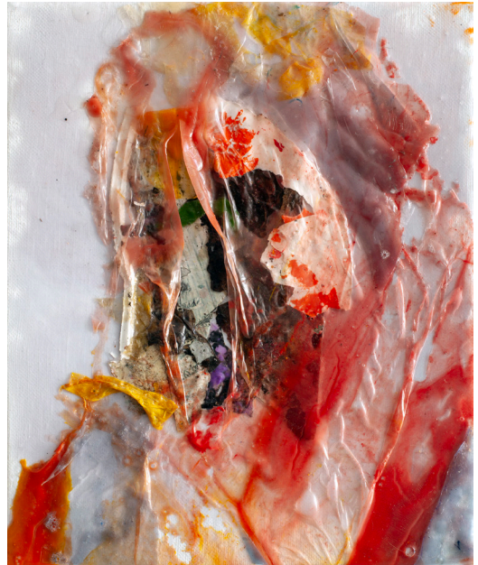
هاني زُعرَب، أسير رقم 20، تشرين الأول 2023 وسائط ومواد متعددة على قماش، 27x22 سم