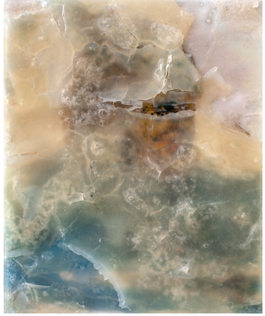
هاني زُعرَب، الفلسطيني رقم 17، 2025 وسائط ومواد متعددة على قماش، 27x22 سم