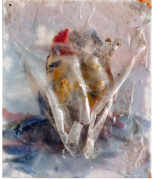
هاني زُعرَب، أسير رقم 12، تشرين الأول 2023 وسائط ومواد متعددة على قماش، 27x22 سم