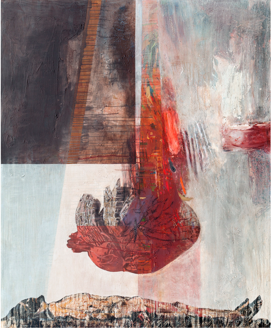
هاني زُعرَب، حب بجودة منخفضة، 2015