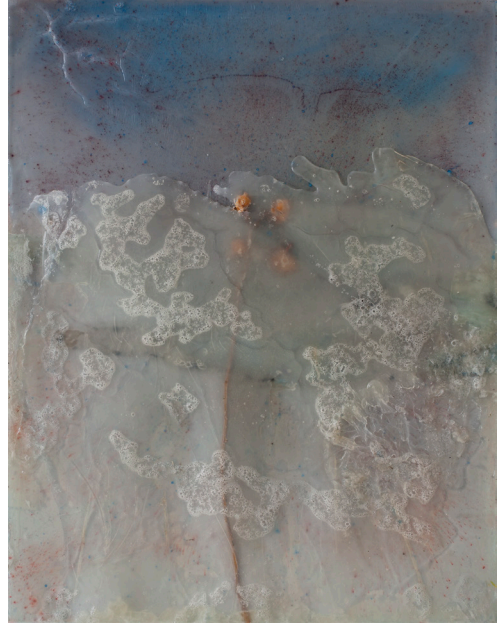
هاني زُعرَب، غزة: بحر من الدموع رقم 1، 2024 وسائط ومواد متعددة على قماش، 65x50x3 سم