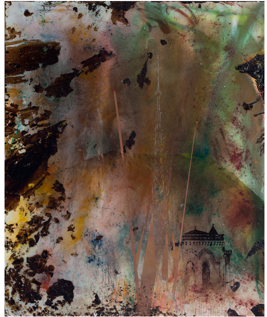
هاني زُعرَب، مَرَيَمَتْنَا، 2019 قطران ومواد مختلفة على قماش، 100x120 سم