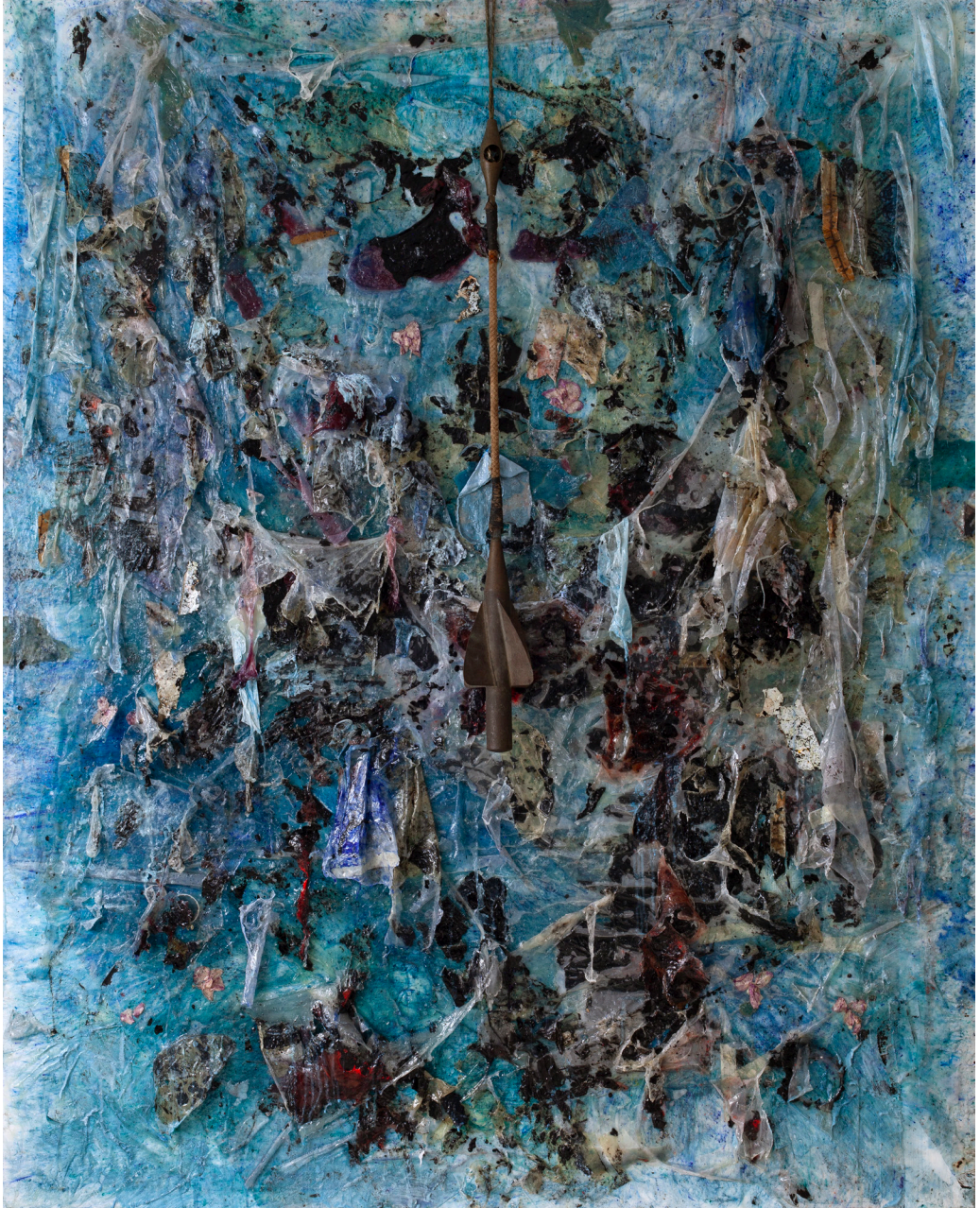
هاني زُعرَب، المَعذرة أيها العالم، هذا هو بحرنا، أيلول 2023 قطران ووسائط ومواد متعددة على قماش، 200x160x15 سم