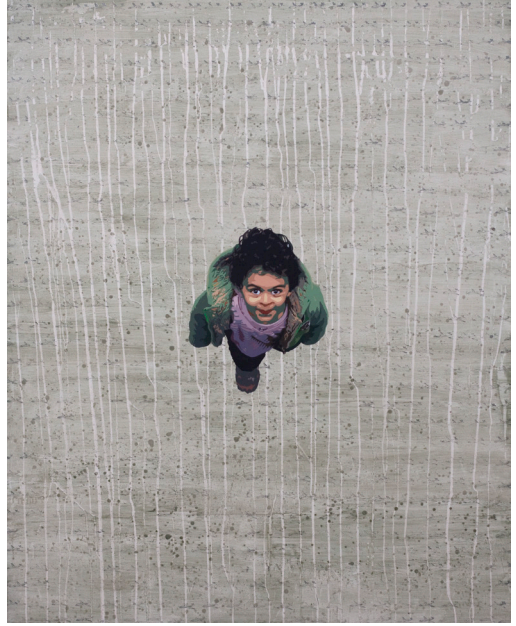
هاني زُعرَب، درس في الطيران رقم 7، 2010 ألوان أكريليك ومواد مختلفة على قماش، 200x160 سم