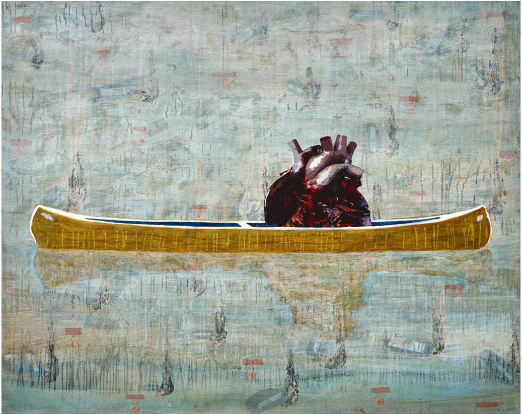
هاني زُعرَب، المعذرة سيد بيتر دوينغ، هذا زورق بحري، 2015