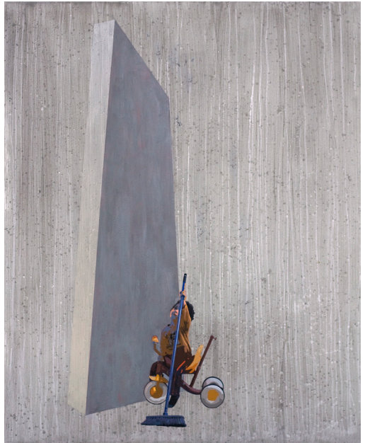
هاني زُعرَب، درس في الطيران رقم 6، 2010 ألوان أكريليك ومواد مختلفة على قماش، 200x160 سم