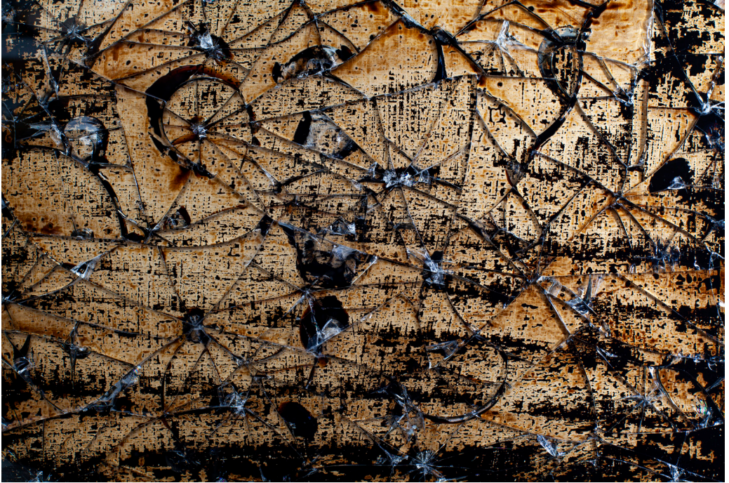
هاني زُعرَب، تفصيل من زمن الرُفت/ زفت تايم رقم 1، 2020

قطران وزجاج ووسائط متعددة على خشب، 67x41 سم